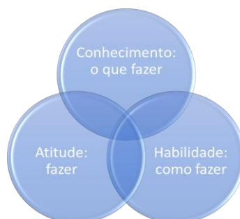
Imagem nº 1. Relação de componentes do conceito de competência.

A imagem a seguir expressa a relação de interdependência dos componentes do conceito de competência.